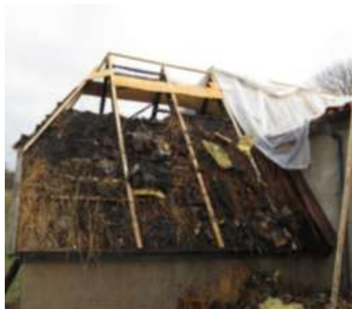
Stråtag udbrændt, bygning skadet