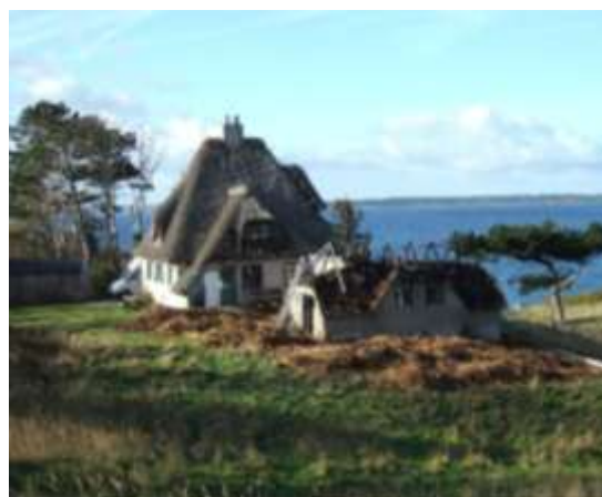
Hovedhuset reddet. Voldsom røg- og sodskade