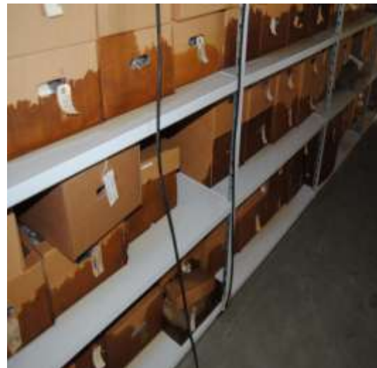
Hele den arkæologiske samling blev ramt