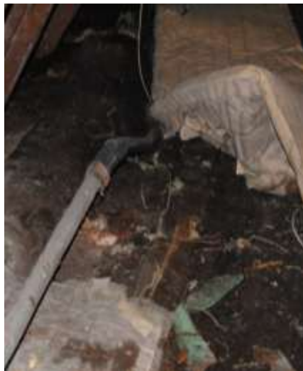
Brandvarmt vand med kemikalier