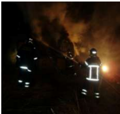
Brand i stråtag, hurtig alarm og indsats