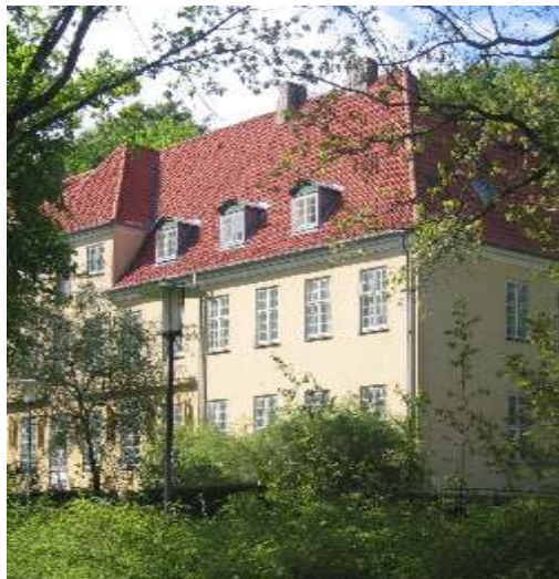
Vand gennem 3 etager to gange på 24 timer