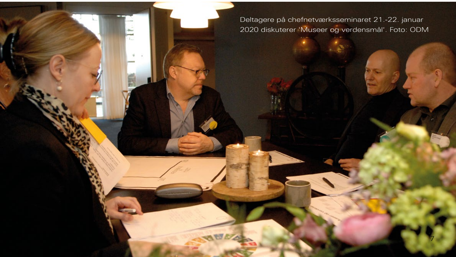
Deltagere på chefnetværksseminaret 21.-22. januar 2020 diskuterer 'Museer og verdensmål'.

Bonanza, indeholder kun en lille del af DR's udsendelser, og skal man bruge andet materiale, kræver det henvendelse til DR, som så meget omstændeligt skal finde det frem. Det er både unødigt dyrt og besværligt og slet ikke det, der var meningen, da DR i sin tid fik midler til at digitalisere sin fantastiske del af den nyere kulturarv. Kulturminister Joy Mogensen valgte desværre at sætte processen omkring et søgbart programarkiv i bero i forbindelse med, at hun rullede den borgerlige regerings medieaftale med DR tilbage i vinteren 2019/20. Vi har stadig fokus på sagen, for