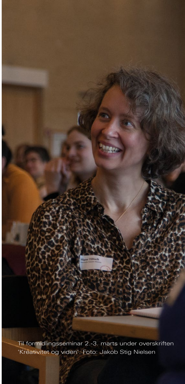
Til formidlingsseminar 2.-3. marts under overskriften 'Kreativitet og viden'.

ODM og DR startede i 2020 samarbejde om fælles formidling af kulturelle events. Vi lagde ud med fejringen af 75-året for befrielsen, hvor ODM var bindeled mellem museerne og DR's tema om jubilæet, hvilket på meget kort tid betød samarbejde med ikke færre end 34 museer rundt i hele landet. Succesen blev fulgt op ved fejringen af 100-året for Genforeningen med Sønderjylland. Begge jubilæer var præget af pandemien – og derfor kunne mange af museernes udstillinger og andre planlagte tiltag ikke komme i spil. Derfor var DR's digitale initiativer og programmer i øvrigt kærkomne. Det er aftalt med DR's ledelse, at der fremover skal afholdes årlige regionale møder – såkaldte pitch – hvor museerne og DR kan udveks-